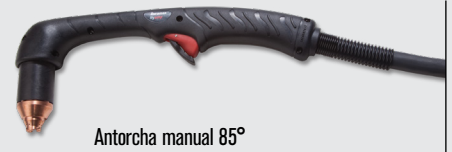
Antorcha manual 85°

Estilos de antorchas robóticas Duramax® Hyamp™ (para ver más opciones de antorchas, visite www.hypertherm.com )