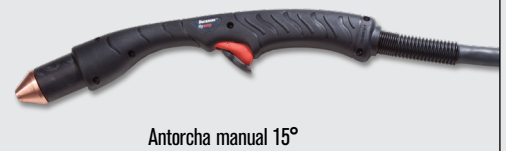
Antorcha manual 15°