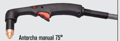
Antorcha manual 75°

(visitar www.hypertherm.com para más opciones de antorchas)